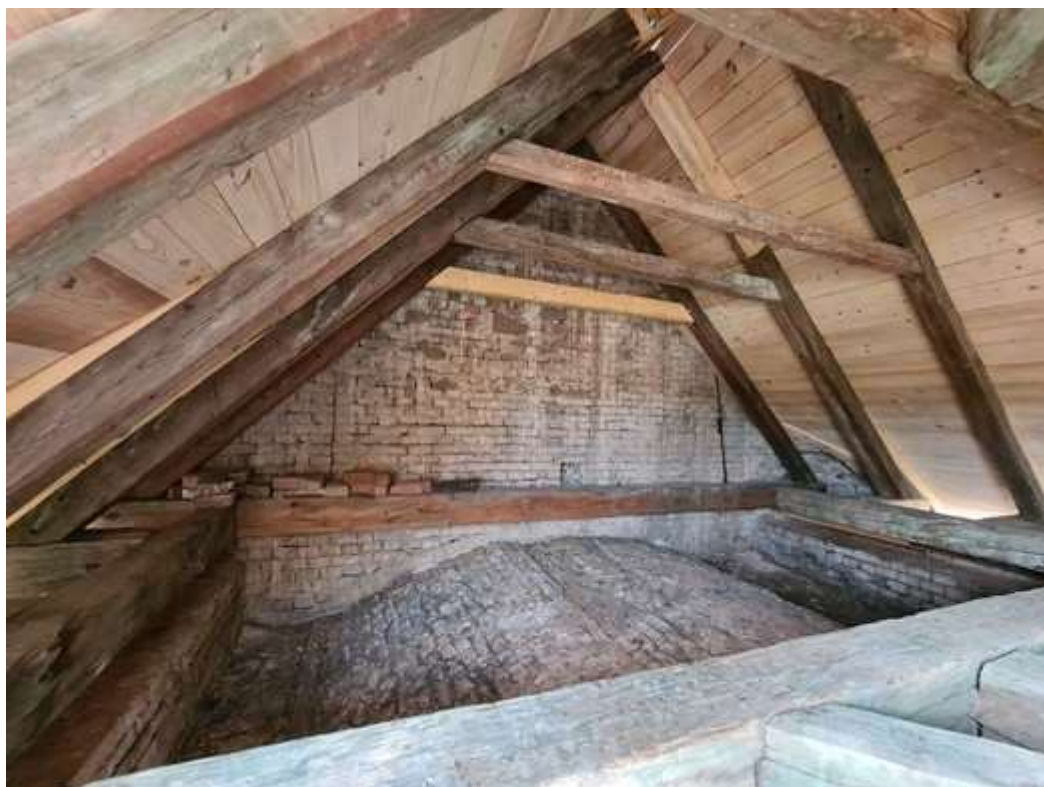
Sakristie - celkový pohled do krovu po provedení výměn a nového bednění (07/2023)