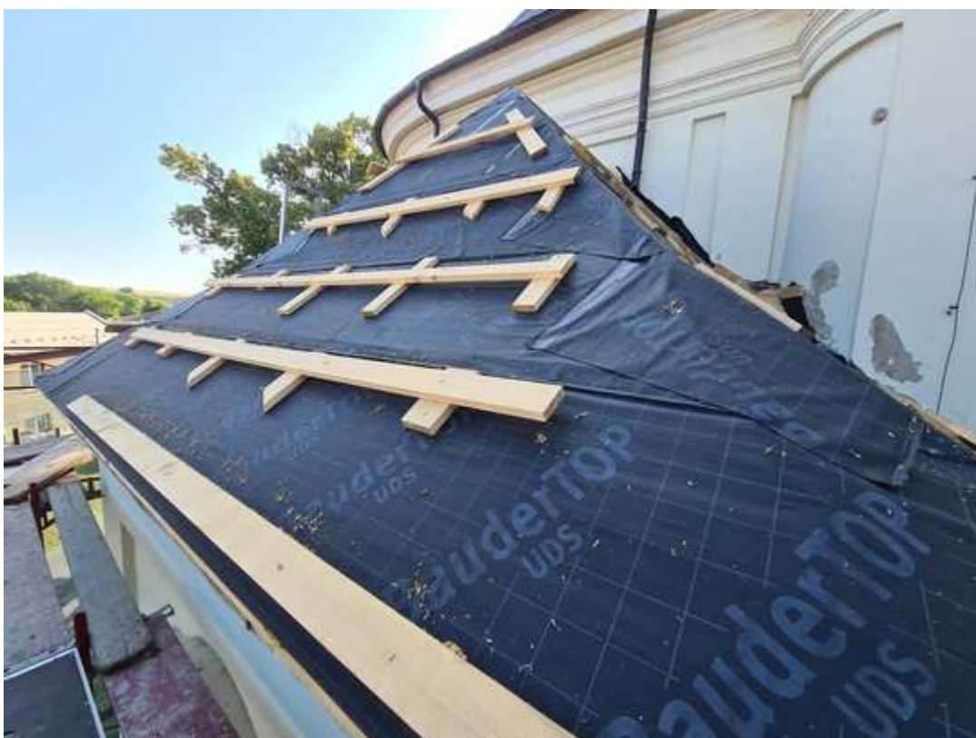
Sakristie - provedení provizorní krytiny z trvanlivé lepenky (07/2023)