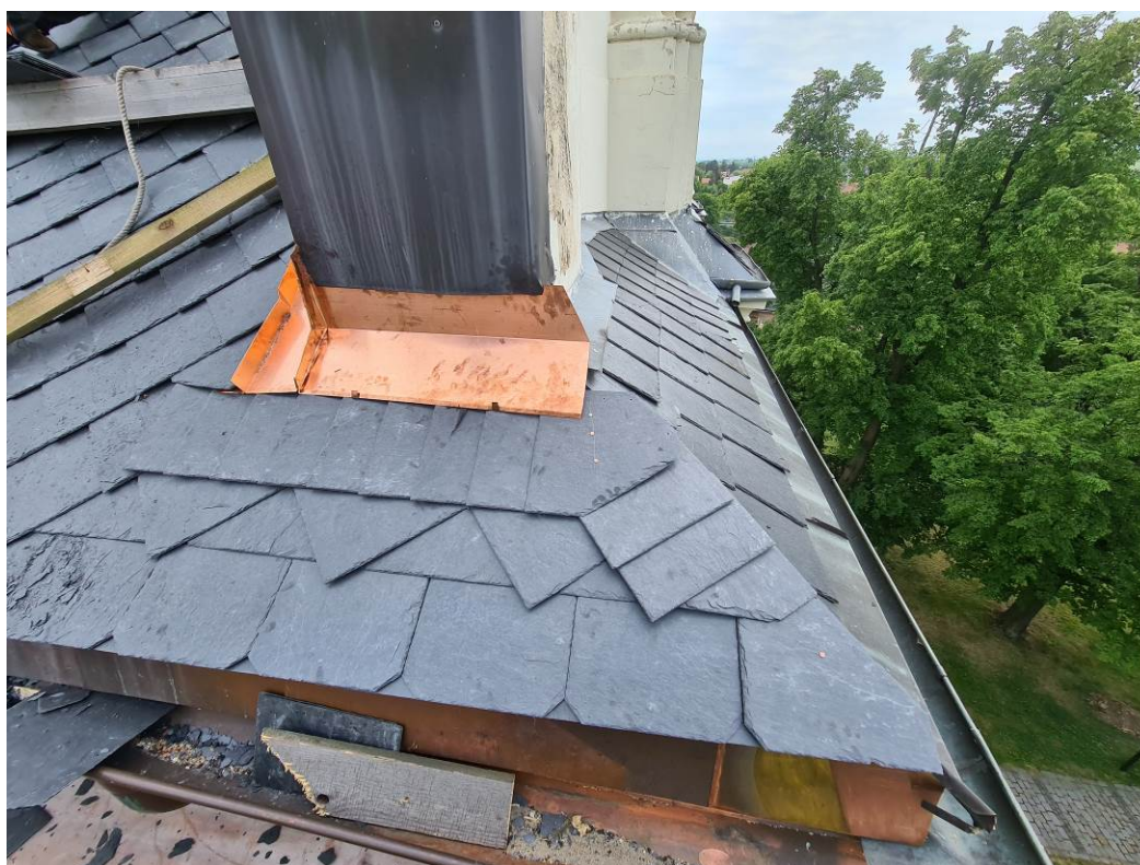
fotografie ze stavby – přechod dokončené západní části střechy hlavní lodi na původní část korunní římsy nad hlavním vstupem (fotografováno z lešení v r. 2022)

Zpracoval: Ing. arch. Zdeněk Beran, projektant 02/2024