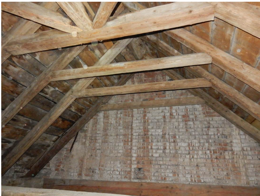
Nálezové fotografie z průzkumu nepřístupného krovu zimní kaple (provedeno z lešení v r. 2021)