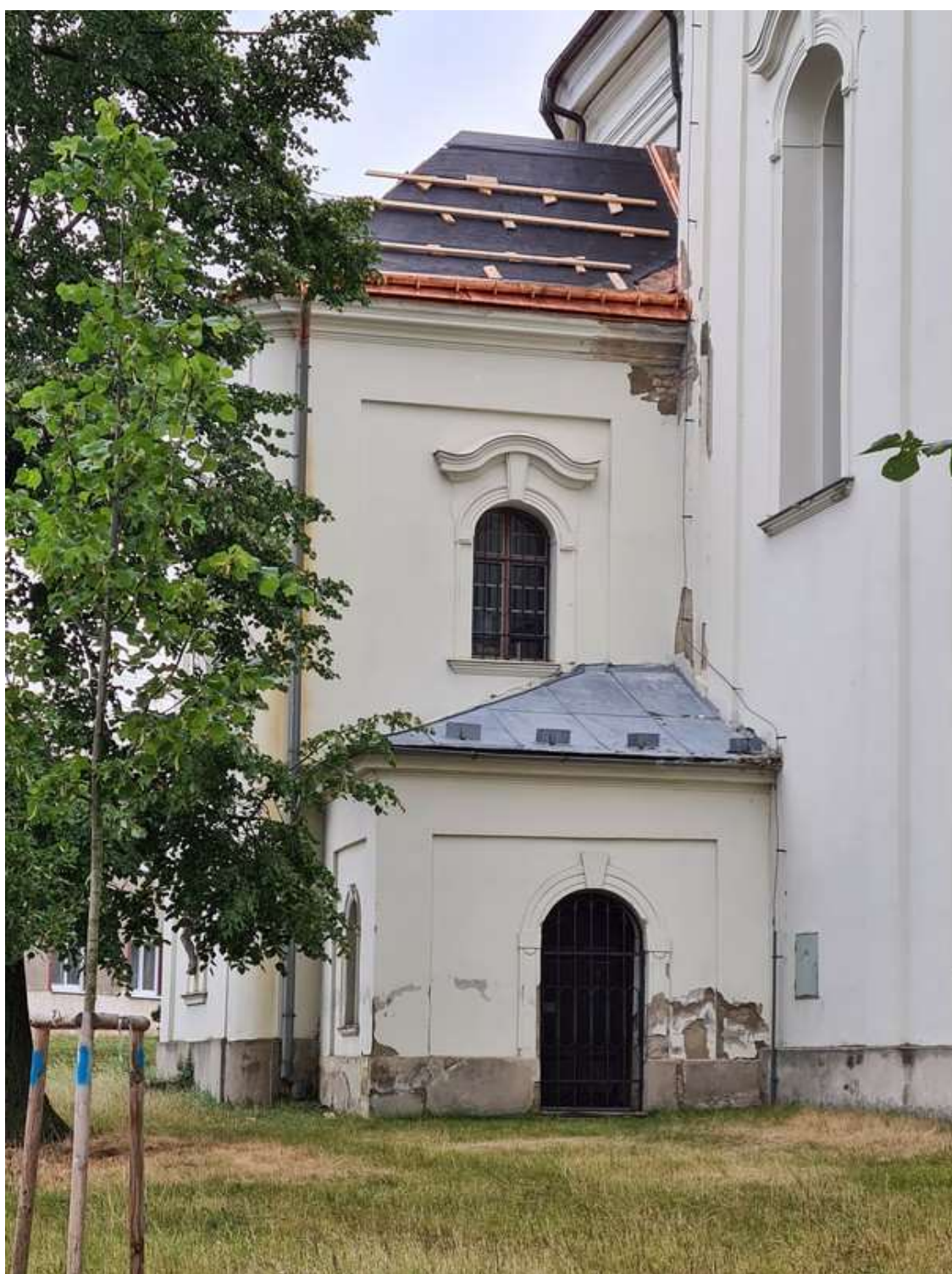
sakristie a vstupní zádveří - celkový pohled na stavbu po dokončení stavební etapy a demontáži lešení (08/2023)

Dokončení pokládky břidlice nad sakristií, celková rekonstrukce krovu a plechové krytiny nad vstupním zádveřím a oprava zatékáním zdegradovaných omítek v úrovni mezi zádveřím a sakristií bude předmětem prací, ve VŘ identifikovaných ve stavební etapě č.1 pro rok 2024.