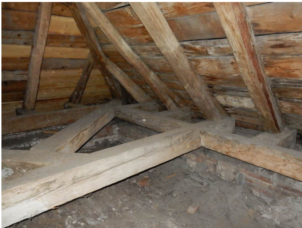
Nálezové fotografie z průzkumu nepřístupného krovu zimní kaple (provedeno z lešení v r. 2021)