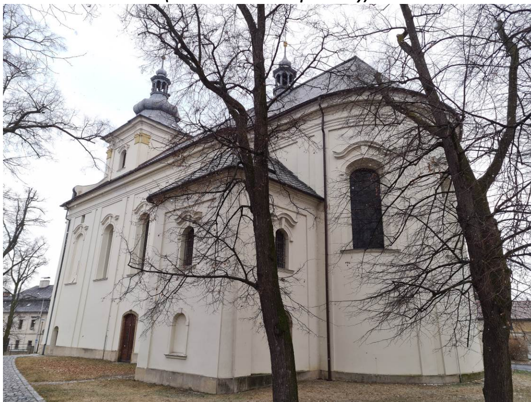
Celkové foto „zimní“ kaple od jihovýchodu (fotografováno v lednu 2024)