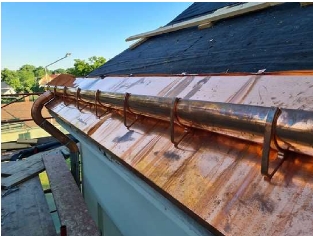
Sakristie - provedení oplechování nástřešního žlabu a úžlabí u hlavní lodi (07/2023)