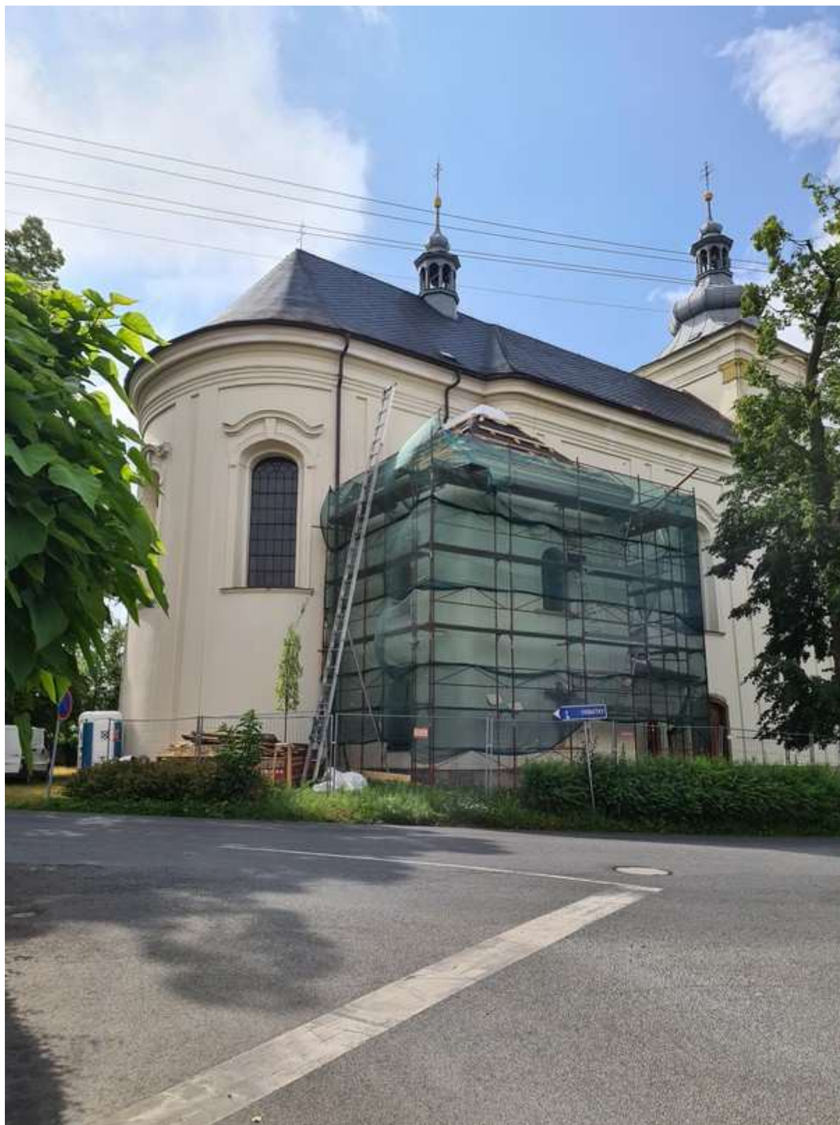
celkový pohled od severu na dokončenou pokládku krytiny hlavní střechy se zachycením prováděné stavební 8. etapy - opravy střechy nad sakristií - fotografováno 07/2023