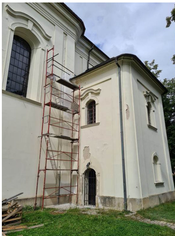
Celkové foto „zimní“ kaple od jihu (fotografováno v srpnu 2021 při opravě zatékání žlabu do fasády)