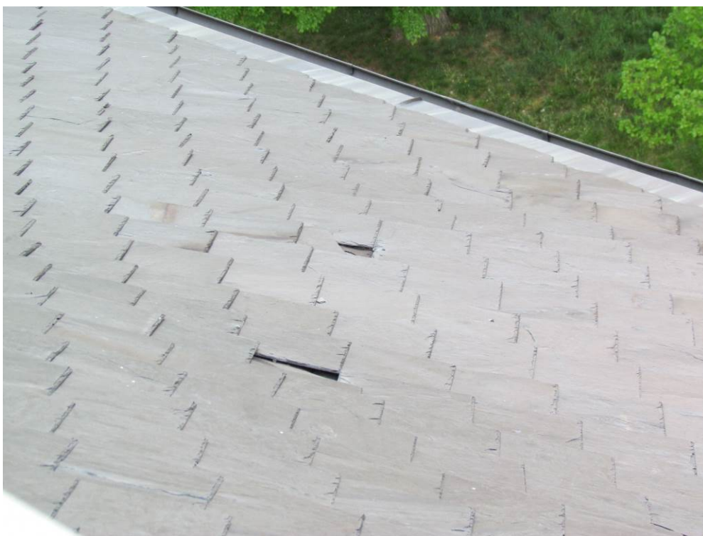
07/2014_pohled z věže kostela na východní sedlo hlavní lodě se sanktusovou věžičkou - typická porucha v ploše střechy – prasklé šablony, uvolněné hřebíky a následně i vypadlé kameny