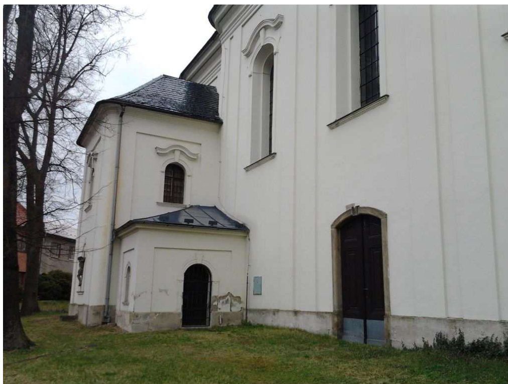
03/2015_celkový pohled na boční kapli od západu - se vstupem do sakristie