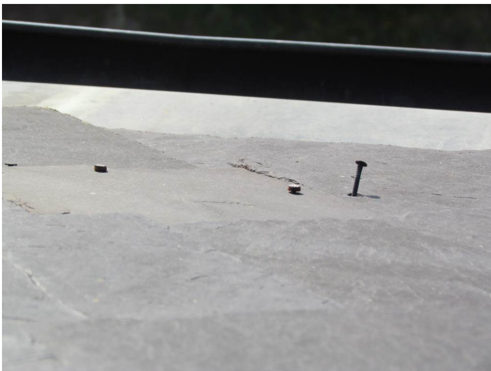
07/2014_pohled z věže kostela na východní sedlo hlavní lodě se sanktusovou věžičkou - detail typické poruchy v ploše střechy – prasklé šablony, uvolněné hřebíky a následně i vypadlé kameny z důvodu použití nevhodných hřebíků v nedostatečném krytí kamenů