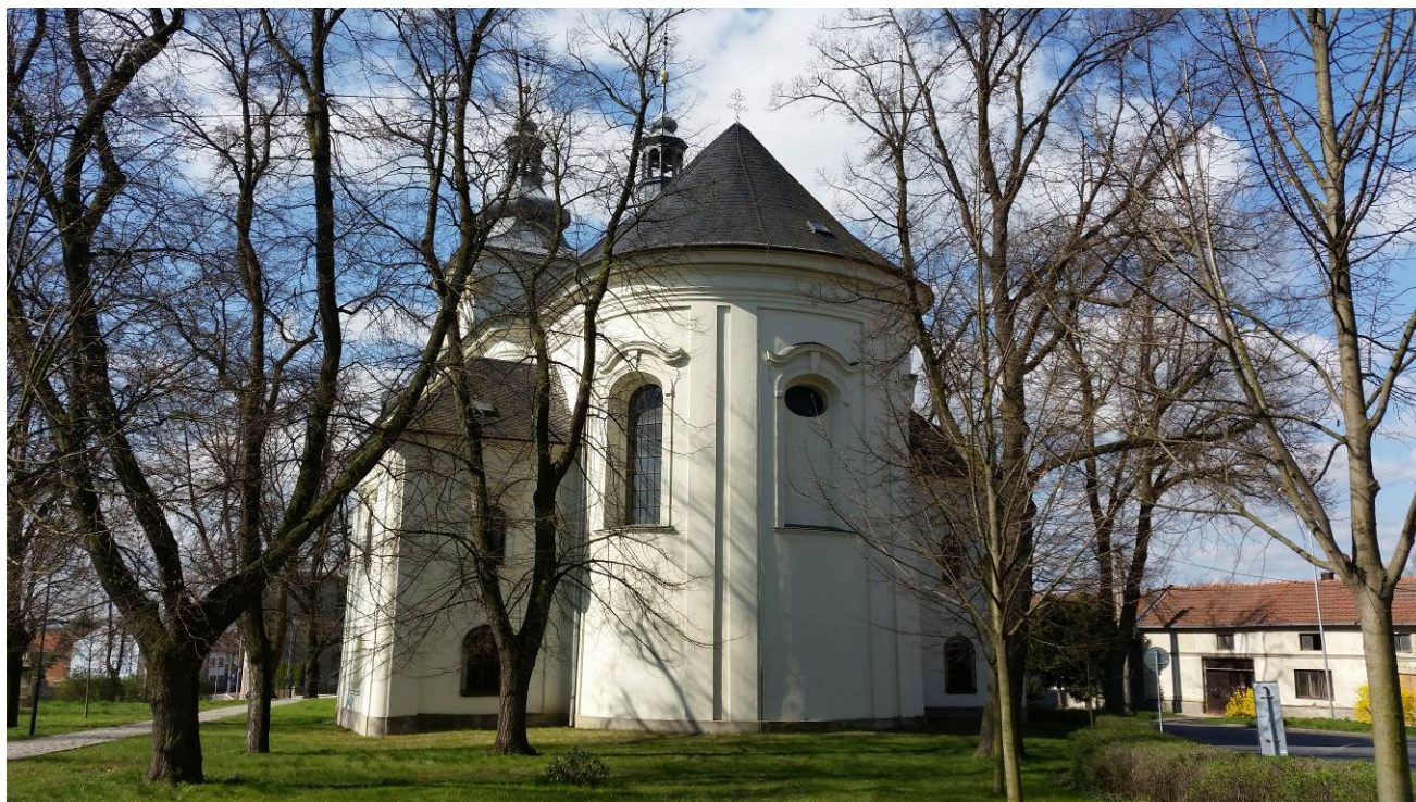
03/2015_celkový pohled od severovýchodu na závěr kostela s presbytářem a dvěma bočními kaplemi