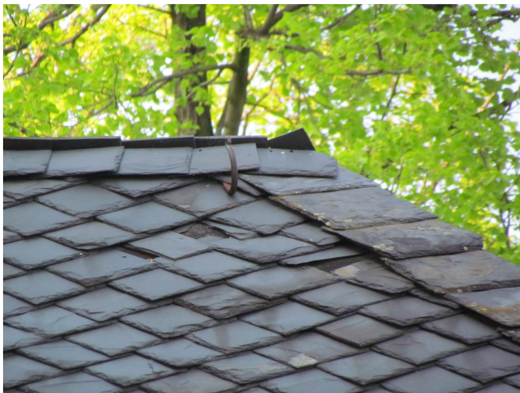
08/2015_detail poruchy v hřebeni a ploše střechy nad boční – východní kaplí – prasklé šablony, uvolněné hřebíky a následně i vypadlé kameny z důvodu použití nevhodných hřebíků ve špatném krytí kamenů